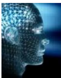
Imagen de nuestro propio cuerpo que formamos en nuestra propia mente, la manera que nos parece nuestro cuerpo a nosotros se basa en estos constituyentes: