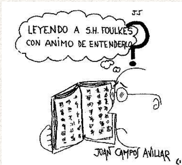
Médico, psicoanalista y grupo-analista.

De siempre me ha sorprendido e intrigado por qué la obra y pensamiento de S. H. Foulkes - fundador del Group Analysis- esté tan poco difundida y sea tan mal entendida por los autores grupales de habla castellana. Siempre me supuse que la barrera iba más allá de una mera limitación idiomática; al fin y al cabo la obra de Bion, igualmente publicada originalmente en inglés, es la que más ha influido en los pioneros de la Escuela Argentina de Grupo. Últimamente he tenido ocasión de comprobarlo.